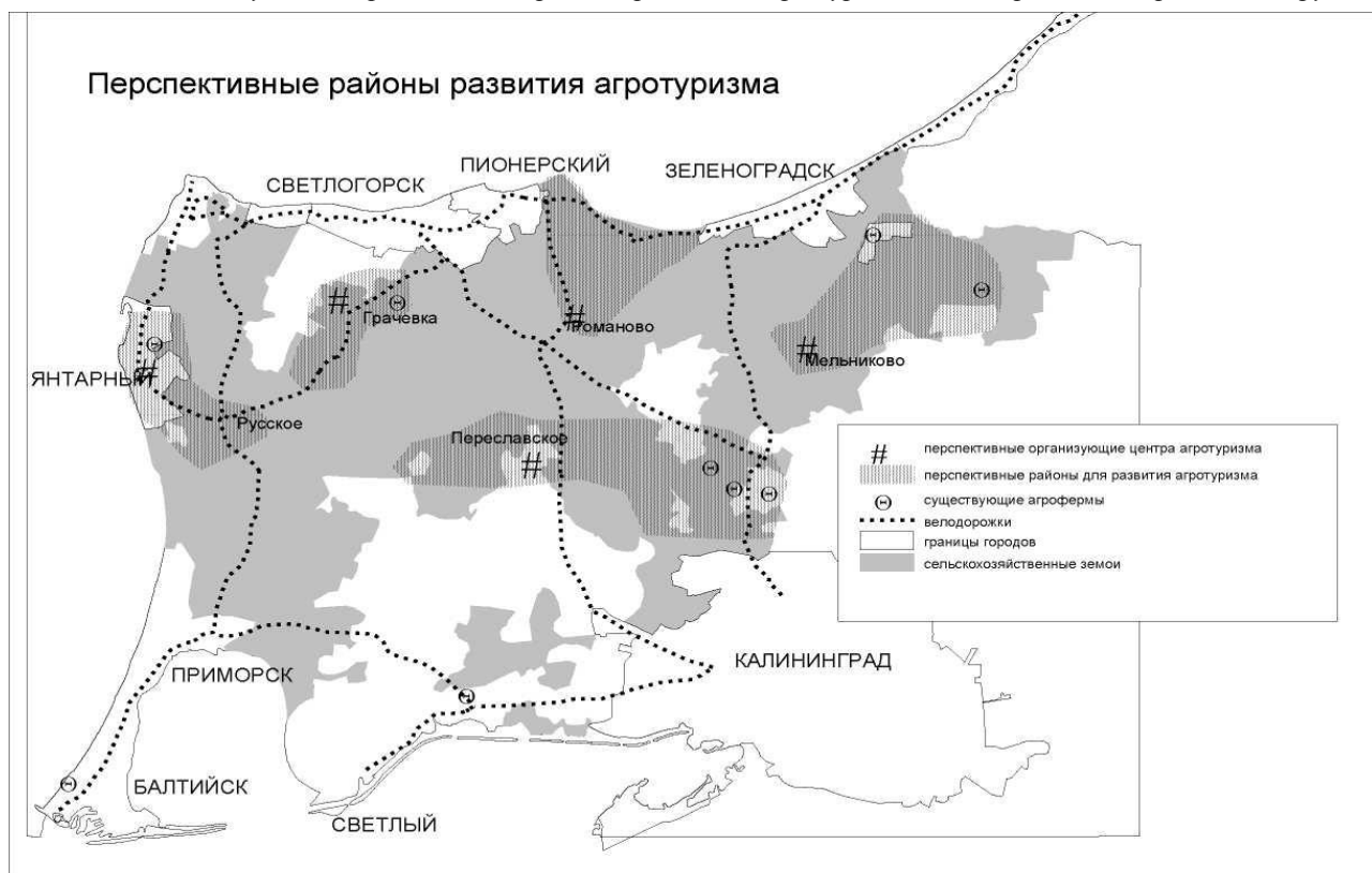
Рисунок 2 Перспективные районы развития агротуризма Зеленоградского городского округа